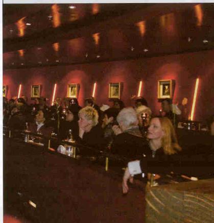
- IMPRESSIONEN 2009 -